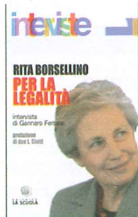
PER LA LEGALITÀ di Rita Borsellino, Editrice La Scuola, pp. 146, € 8,50